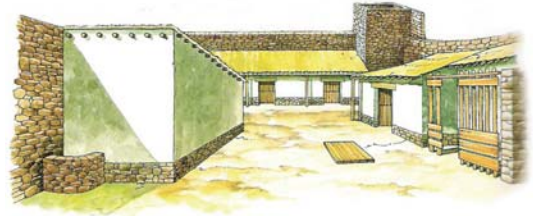
Restitució de l'interior de Puig de Castellet vist des del sud