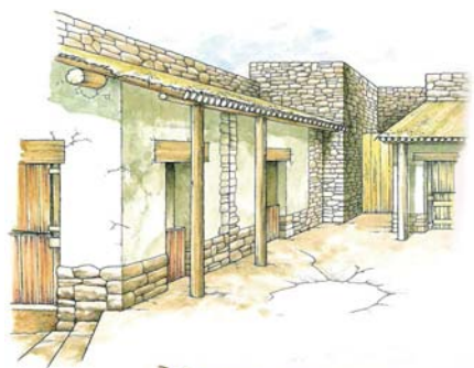
Restitució de l'interior de Puig de Castellet vist des de l'oest