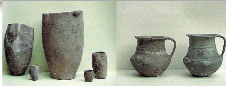
Olles i petits vasos fets a mà

El jaciment va ser identificat el 1943, però no es va començar a excavar fins l'any 1968. Després d'uns anys de treballs esporàdics, el Centre d'Investigacions Arqueològiques de Girona, en col·laboració amb l'Ajuntament de Lloret de Mar, va iniciar una excavació sistemàtica de l'assentament que es va desenvolupar entre els anys 1975 i 1986.