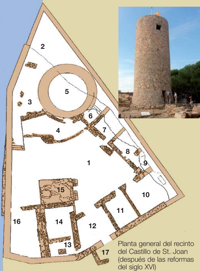
Planta general del recinto del Castillo de St. Joan (después de las reformas del siglo XVI)