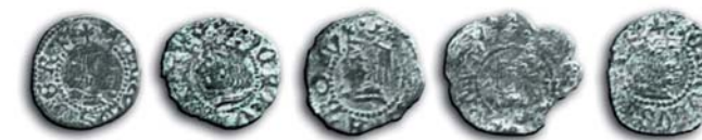
Hallazgo numismático (monedas de vellón) 1-2-5 - Carles I · 3-4 Joana I y Carles I (Real) - (1516-1556)

Hasta finales del s. XVII el castillo aún estuvo en funcionamiento, como lo prueban los materiales arqueológicos encontrados. En estos siglos el castillo servía sobretodo de torre de vigía para prevenir los posibles ataques marítimos.